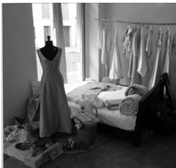
L'allestimento della campagna Giuste Nozze in bottega