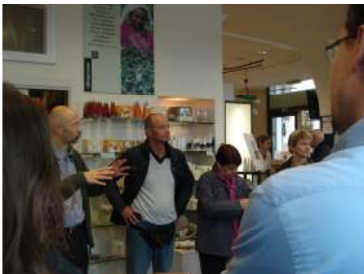
La visita dei soci a Mandacarù, Trento, 2 ottobre 2010